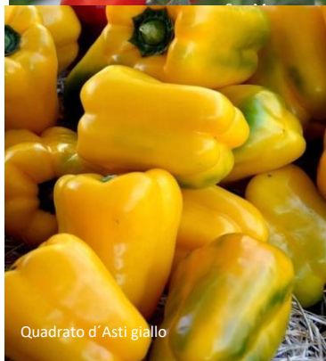
Quadrato d' Asti giallo